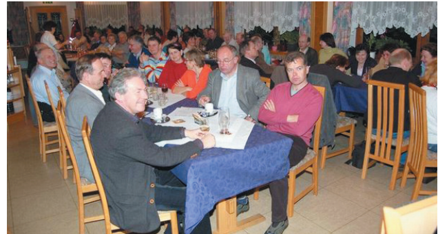
Viele Bürger nutzten die Chance um sich zu informieren

Für die Besucher, die sich ganz genau informieren wollten, wurden nähere Informationen zu den Projekten auf Schautafeln präsentiert.