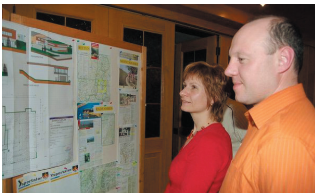
Reges Interesse bei den Schautafeln für die Pläne des neuen „Haus der Musik“

Vom Gemeindeverband der Yspertaler Musikschule mit den Mitgliedsgemeinden Yspertal, St. Oswald, Dorfstetten, Nöchling, Bärnkopf, Hofamt Priel und Persenbeug-Gottdorf werden derzeit circa 325 Schüler unterrichtet. Noch heuer soll ein Zusammenschluss mit dem Musikschulverband Pöggstall und Münichreith-Laimbach zum "Gemeindeverband der Musikschule Yspertal – Südliches Waldviertel" erfolgen.